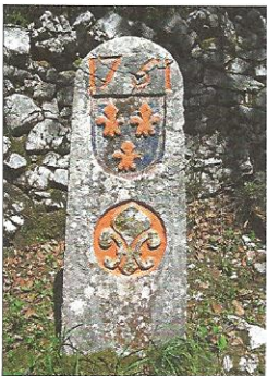
1751 - Borne entre le Pays de Vaud bernois et le Royaume de France. Armoiries: Ours de Berne et trois lys de France de 1751. Ecusson vaudois et lys ajoutés en 1824.