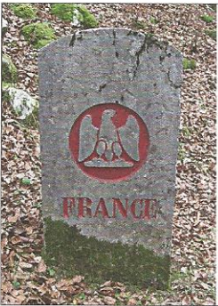
1863 - Borne entre le canton de Vaud et le second Empire français. Armoiries: Ecusson vaudois et aigle impérial.