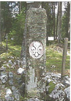
1415 et 1553 - Borne entre le Pays de Vaud et la Franche-Comté. Années 1553 et 1824 visibles. Armoiries: reste d'ancien écu. Ecusson vaudois et lys ajoutés en 1824.