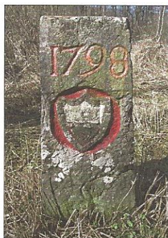
1774 - Borne entre le Pays de Vaud et la France martelée en 1798 par la République Helvétique Une et Indivisible (RHUI). Ecusson vaudois et lys ajoutés en 1824.