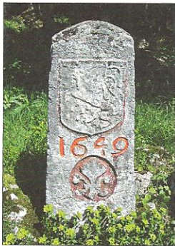
1649 - Borne entre le Pays de Vaud bernois et la Franche-Comté espagnole. Armoiries: Ours de Berne et Lion de Franche-Comté de 1649. Ecusson vaudois et lys ajoutés en 1824.