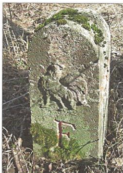
1930 - Borne entre la Suisse (canton de Vaud) et la France. Armoiries: Croix fédérale et coq républicain.